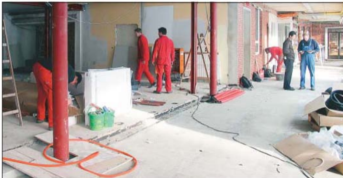
Auf eine Baustelle werden die Kinder stoßen, die heute nach den Ferien die Schule an der Feldbreite besuchen. Auch am Standort Wilhelmstraße wird noch gebaut.

ERWEITERUNG KGS Rastede wird Ganztagschule – Baumaßnahme läuft noch