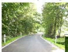
Fahrbahn nach Fertigstellung Mit Randmarkierung, Leitpfosten, Bäumenherstellung