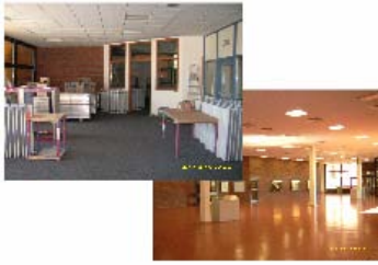
Umbau der KGS zur Ganztagschule

In den diesjährigen Sommerferien wurde das Forum, die vom Forum abgehenden Flure und der Musikübungsraum vollständig renoviert. Nach dem Einbau neuer Wände und Türanlagen wurden die Akustikdecken saniert, die Beleuchtung erneuert, neue Fußböden verlegt und Malerarbeiten ausgeführt.