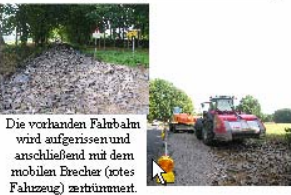
Ausbau Loyer Weg / Hankhauser Weg

Der Loyer und Hankhauser Weg sind in den Sommerferien für rund 318.000 Euro saniert worden. Das hier erstmalig eingesetzte „Mixed-at-place-Verfahren“ hat sich bestens bewährt. Bei diesem Verfahren werden die vorhandenen Steine an Ort und Stelle gebrochen und mit Zement und zusätzlichen Mineralgemisch gemischt, aufgearbeitet und anschließend wieder als Frostschutzschicht eingebaut.