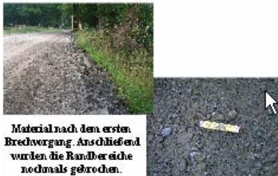
Ausbau Loyer Weg / Hankhauser Weg

Im Anschluss erfolgt die Herstellung der Fahrbahn mit einer bituminösen Tragschicht, bevor zu guter letzt die Asphaltdecke aufgebracht wird.