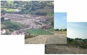
Baugebiet südlich Schlosspark

Am Freitag, 1. September, hat termingerecht der Grenztermin mit den neuen Grundstückseigentümern und damit auch die Freigabe der Baugrundstücke stattgefunden. Bereits am darauf folgenden Montag sind die ersten Baugrundstücke ausgekoffert worden.