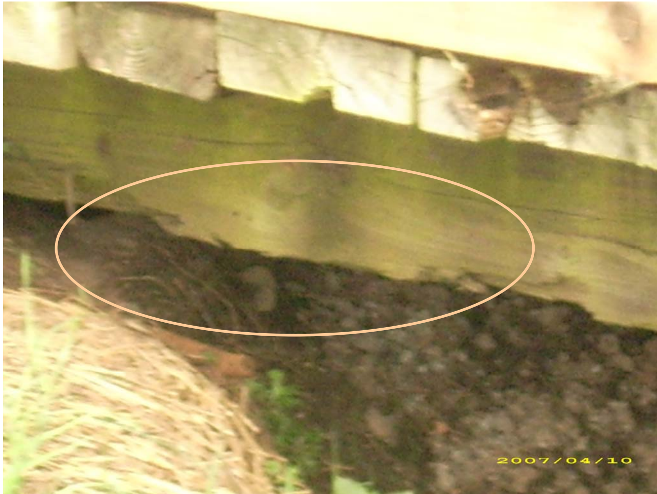
Leichte Querschnittreduzierung am Hauptträger