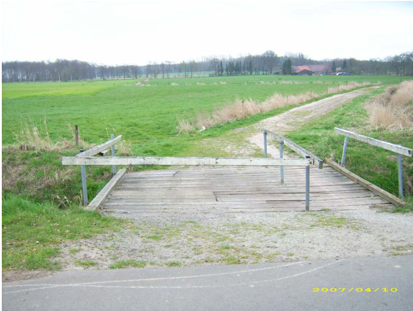
Blickrichtung zur Straße Hohe Horst Belag ist nicht verkehrssicher