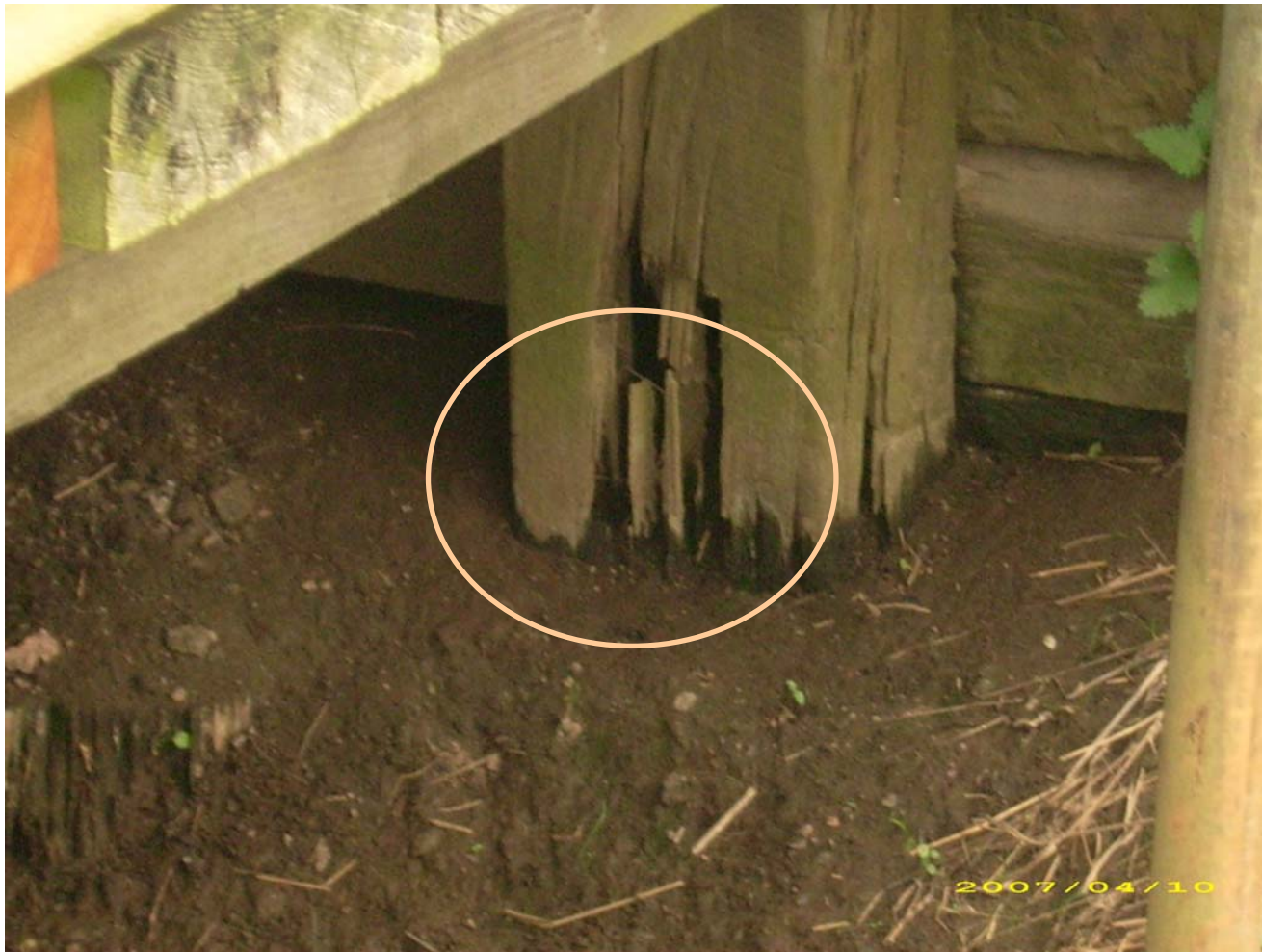
Detail eines angerotteten Ständers