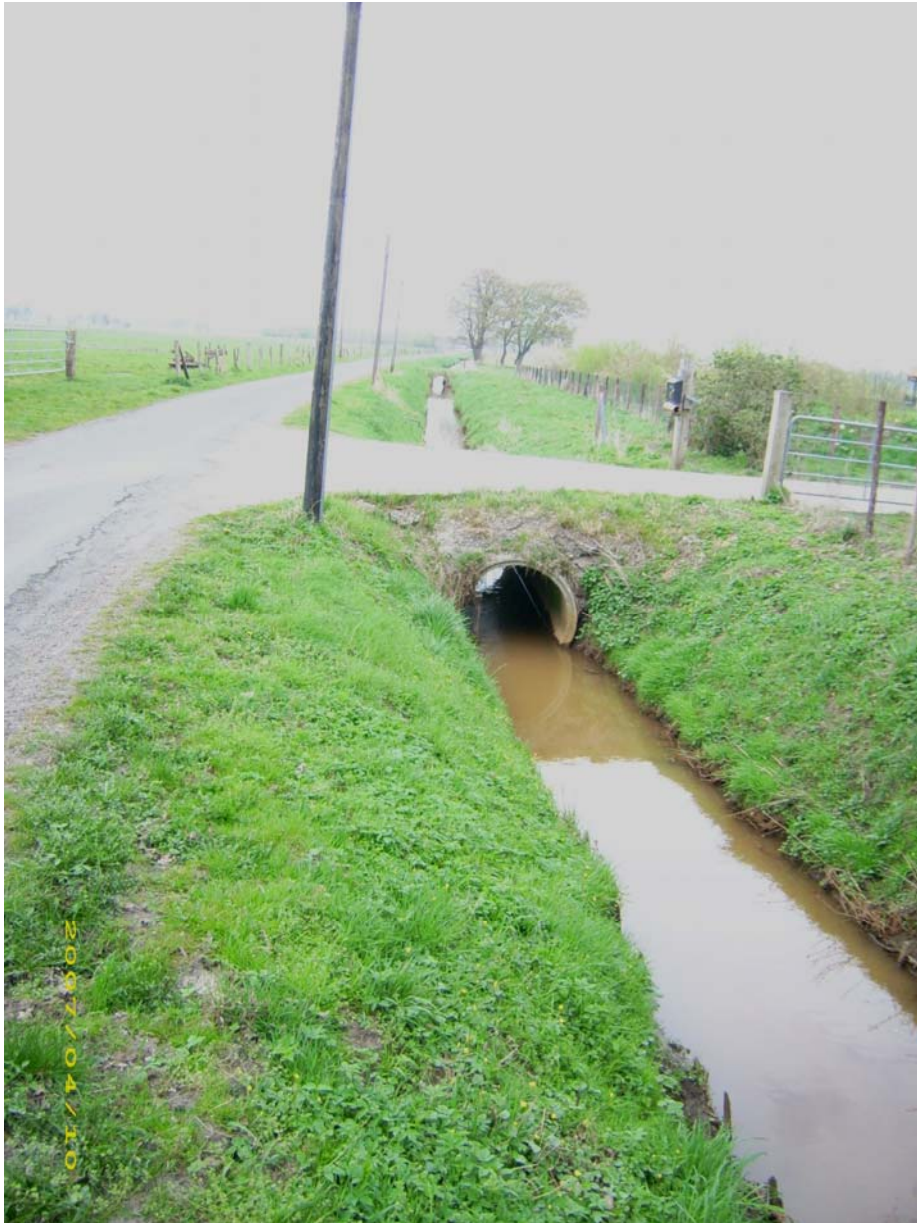
Durchlass in Höhe der Falknerei an der Straße Im Göhlen