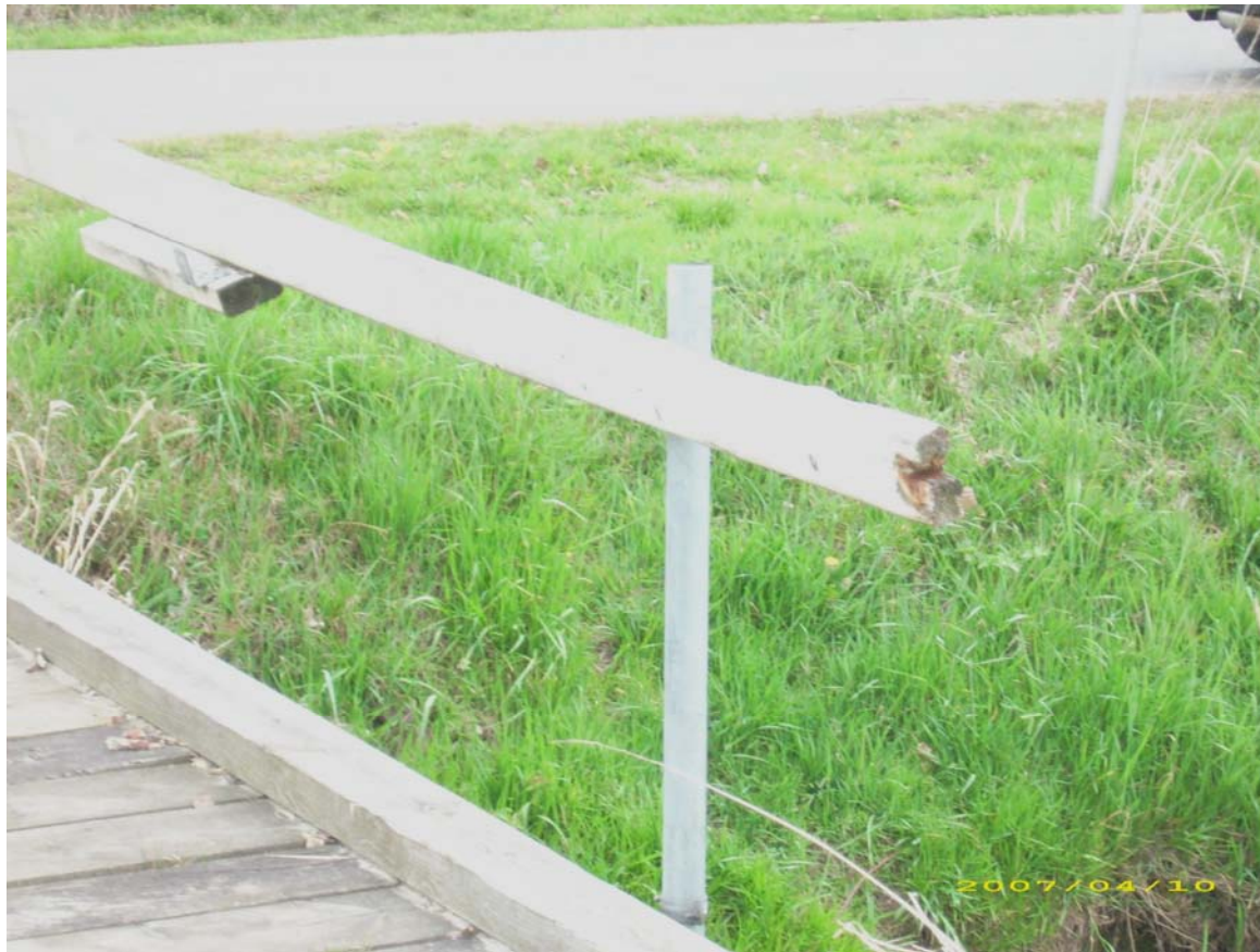
Starke Verrottung an den Handläufen des Geländers