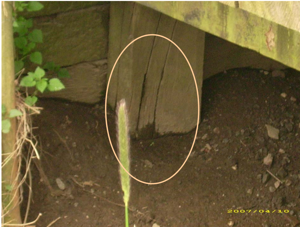
Beginnende Verrottung an den Ständern