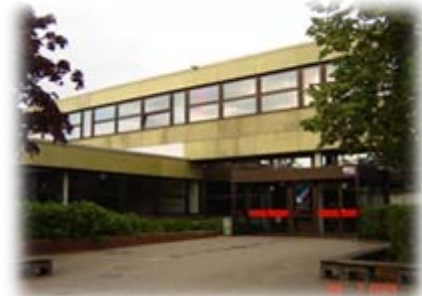
III. BA 1975