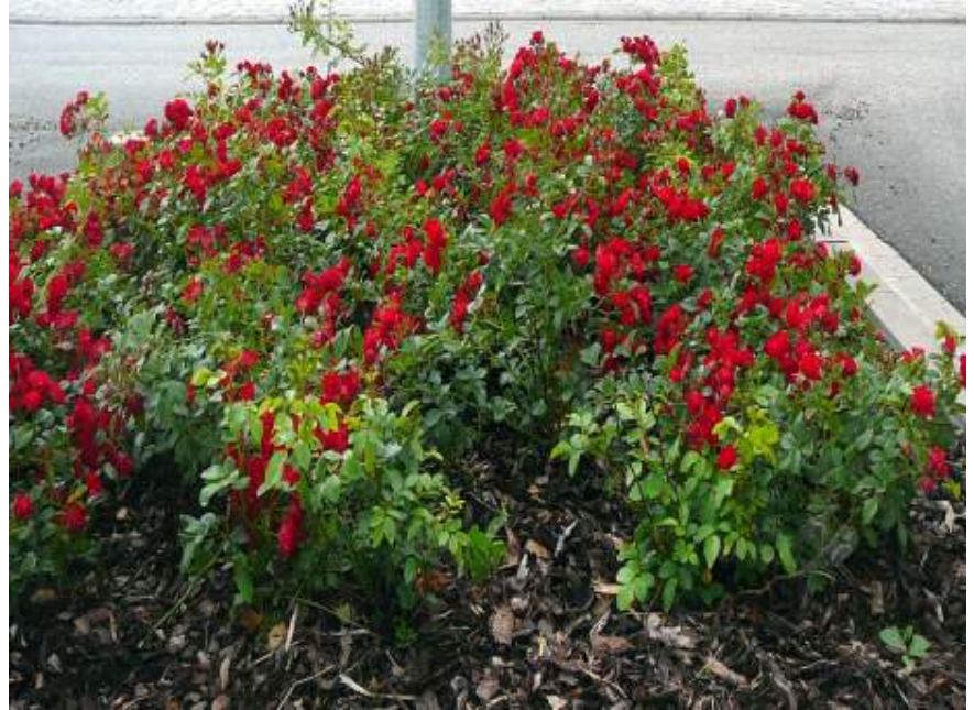
Rosa Scarlet Meidiland