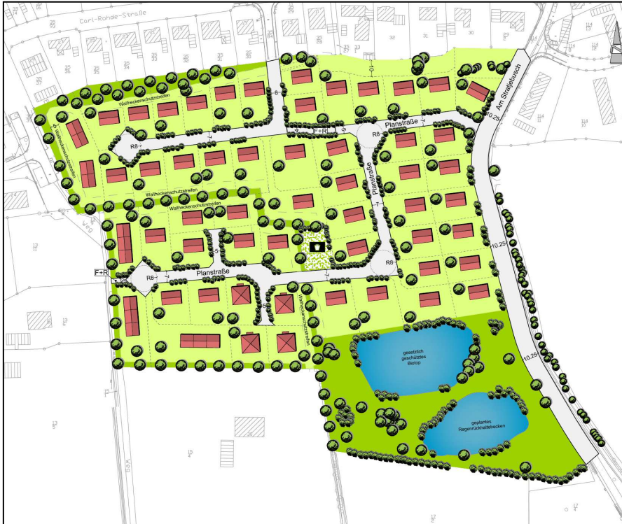
Abb. 1: Städtebauliches Entwicklungskonzept zum Wohngebiet „Am Stratjebusch“

grundstücke im westlichen und nordwestlichen Randbereich vorgesehen. Die Realisierung des Konzeptes erfolgt in zwei Bauabschnitten. Der Bebauungsplan Nr. 107 dient dabei der konkreten Gebietsentwicklung für den zweiten Bauabschnitt. Hierüber werden ca. 9 Baugrundstücke für Einzel- und Doppelhäuser sowie Grundstücke für Mehrfamilienhäuser erschlossen. Die Inhalte dieser Bauleitplanung werden weitestgehend aus dem städtebaulichen Entwicklungskonzept entwickelt.