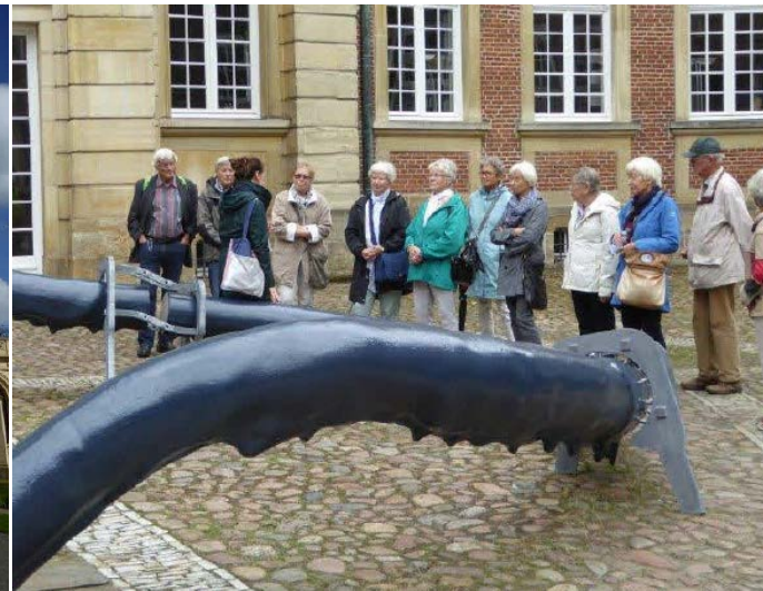
KKR e. V. – Bericht Kultur- und Sportausschuss 2020