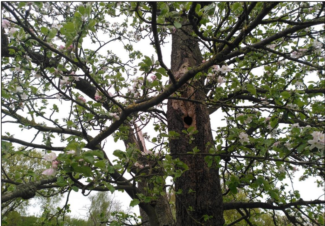
Abbildung 9: Spechthöhle im Stamm des Habitatbaums.