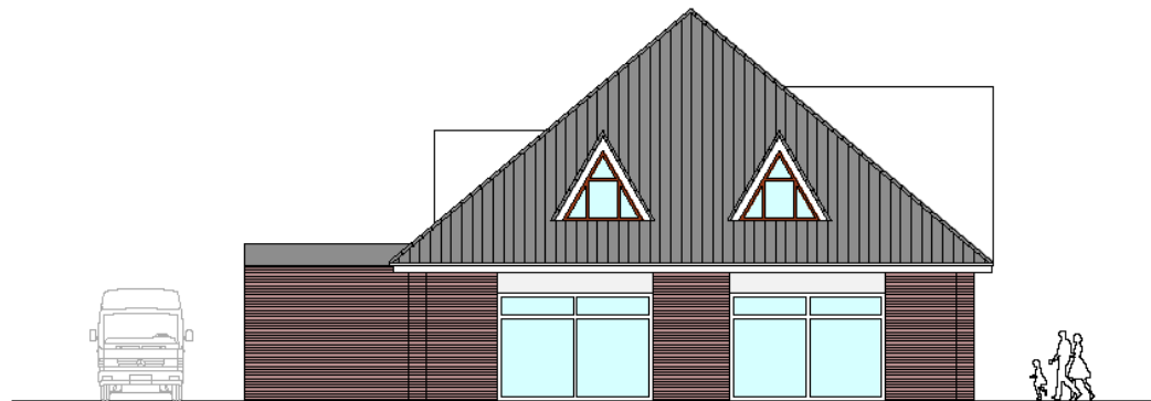
ANSICHT VON NORD-WESTEN

ERWEITERUNG ROSSMANN OLDENBURGER STRASSE 274 - 276 26180 RASTEDE