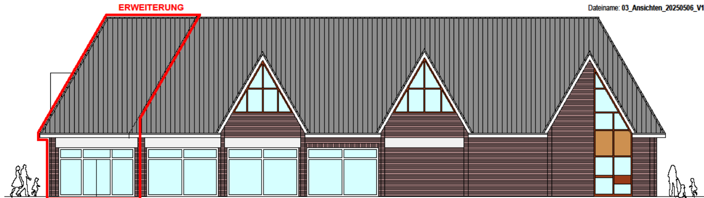
ANSICHT VON SÜD-WESTEN ( OLDENBURGER STRASSE)