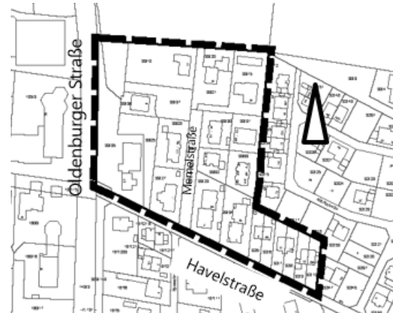
3. Änderung des Bebauungsplanes 34