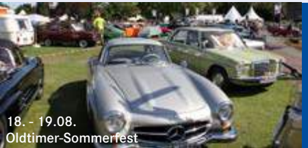
18. - 19.08. Oldtimer-Sommerfest

04.08. 10:00 R Radtour „Ammerländer Spezialitäten“ bitte anmelden: Tel. 04402 86385510