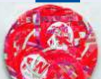
03.06. Collagen - Montagen“