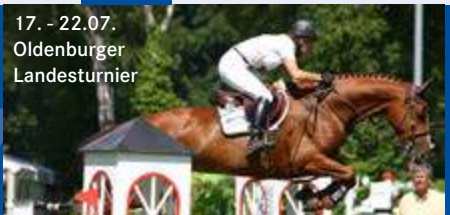
17. - 22.07. Oldenburger Landesturnier

01.07. 16:00 G St.-Ulrichs-Kirche mit Krypta