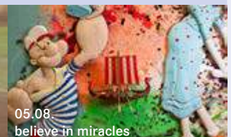
05.08. believe in miracles