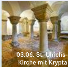
03.06. St.-Ulrichs- Kirche mit Krypta

01.06. 13:00 R Radtour „Kleine Rhododendrontour“ bitte anmelden: Tel. 04402 86385510